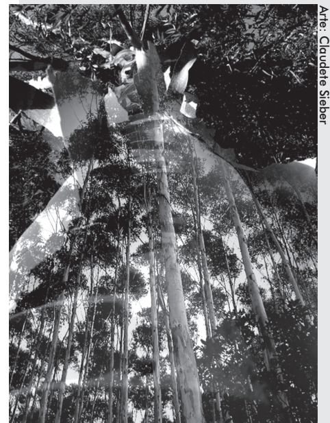
Arte: Claudete Sieber

“Esses setores ganham sempre, mesmo na crise. Agora é preciso entender que aquela expansão anunciada já não tem mais espaço nesse cenário”