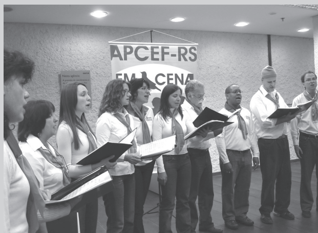
Apresentação em 2008 na Praça da Alfândega