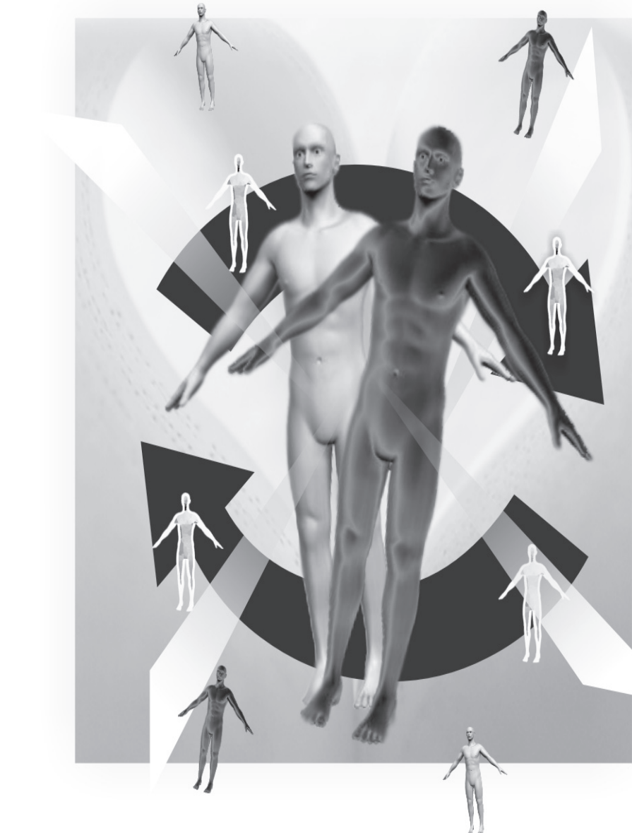
Arte: Rodrigo Vizinho/D3 Comunicação

maioria da população brasileira doaria seus órgãos para transplante. Essa afirmativa é válida para todas as faixas etárias e de renda, qualquer classe social, nível de escolaridade e religião e independe do sexo. Foram entrevistadas mais de 2.000 pessoas de 118 municípios, entre 16 e 19 de março de 2009, para quem foi feita a seguinte pergunta: Você doaria órgãos do seu corpo para serem transplantados após sua morte? 64%